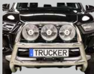
Fat Bar hög