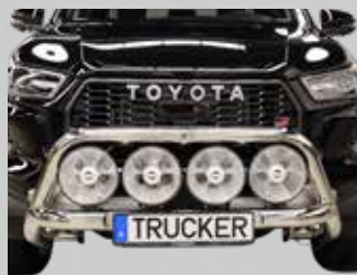
Fat Bar låg