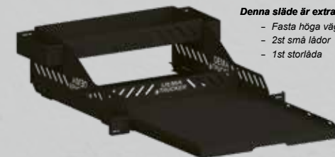
Denna släde är extra utrustad med:

OBS! Tillbehören passar bara till Heavy Duty lastsläden