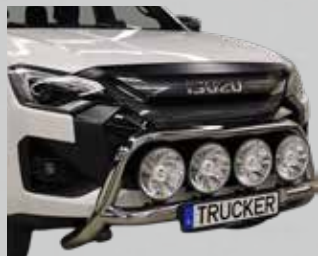
Fat Bar låg