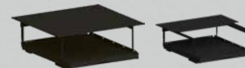
Dubbla lastytan! Smidigt 2-delat övre lastgolv.

OBS! Tillbehören passar bara till Heavy Duty lastsläden