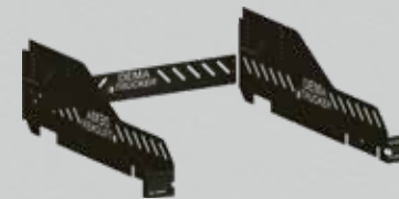
Utnyttja hela flaket! Fasta höga sidor.