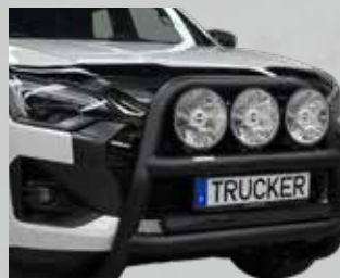
Fat Bar hög