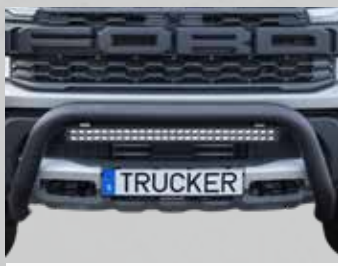
Super Bar Wide