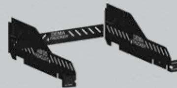
Utnyttja hela flaket! Fasta höga sidor.