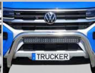
Super Bar Wide