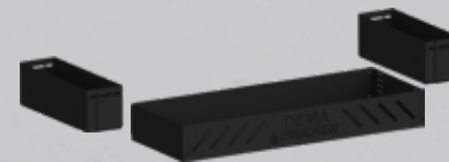
Mer förvaring! Lådor stora som små.