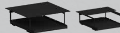
Dubbla lastytan! Smidigt 2-delat övre lastgolv.

OBS! Tillbehören passar bara till Heavy Duty lastsläden